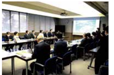
市大学長などと意見交換(1月18日)

横浜市立大学福浦キャンパスを訪れ、再生医療研究やメタバース診療所など最新の研究を聴取。また、先端医科学研究センター・新興感染症研究センターでの最新の研究現場を訪れ、今後の研究成果に期待を寄せました。