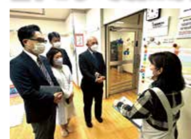
北部療育センター(11月28日)

北部療育センターの通園・診療施設等を視察し、低年齢化する相談対応の現状、求められる支援の変化や課題などを伺いました。