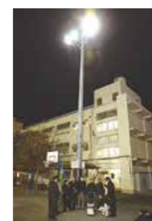
地域の方と設置現場に(1月25日)

戸塚区の柏尾小学校を訪問。地域のスポーツの場の拡充と、災害時では地域防災拠点での安心の場の提供として、小中学校グラウンドへの夜間照明設置を推進しています。